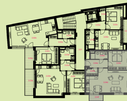
situace bytové jednotky celkový půdorys