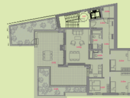
situace bytové jednotky